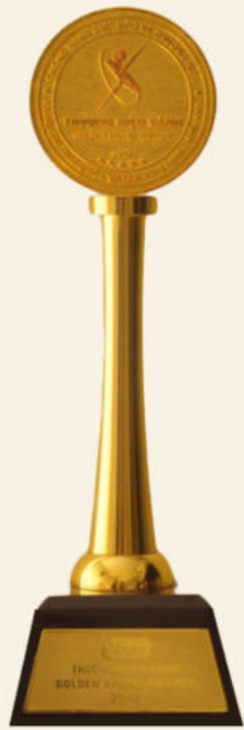
Thương hiệu vàng 2012