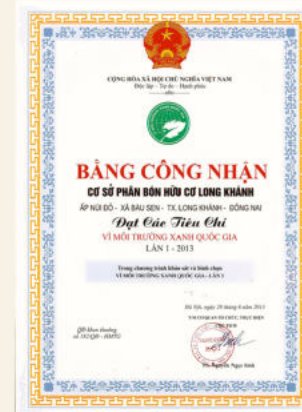
Omixon nhận giải thưởng Vi Môi Trường Xanh Quốc Gia năm 2013